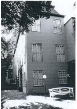
Seitenflügel, Hoffassade (F: Juli 1995. M. Christensen)