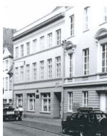
Königstr. 9. F: Mai 1995 (M. Christensen)