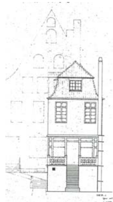
Architekten Fickert/ Becker, 1978: nicht Saalanbau, nicht realisiert