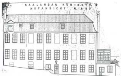
Seitenflügel, Hofansicht, nicht ausgeführt, 1978