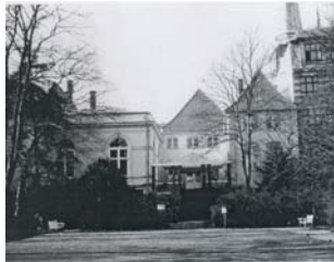
Fassade, rückwärtige. F: April 1995 (M. Christensen)