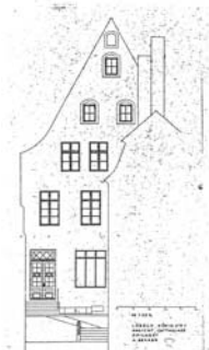
Ostfassade, nicht ausgeführt Architekten Fickert /Becker 1978