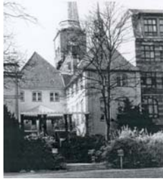
Fassade, rückwärtige Vorderhaus, Seitenflügel. Nr. 5-7. F: April. 1995 (M. Christensen)