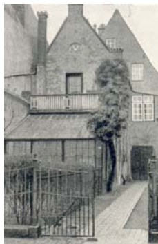
Hartengrube 10, Foto 1938 (?)