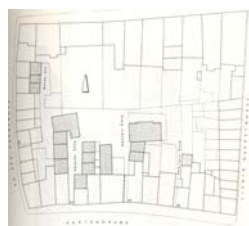
Block 52 um 1980