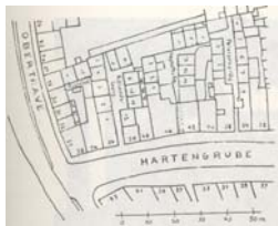
Block 52 um 1922