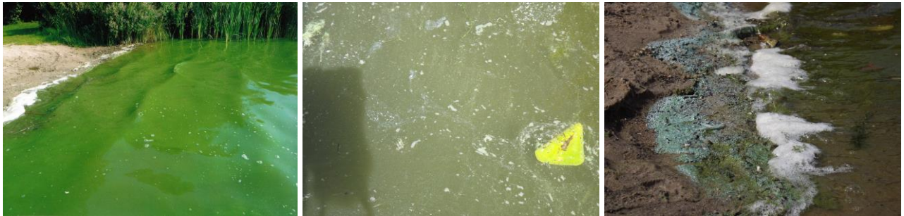
Bildung von Blaualgentepichen, starke Trübung, Schaumbildung