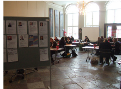
Foto: Speed Coaching für Frauen 2012

www.bpw-luebeck.de oder www.frauenbuero.luebeck.de