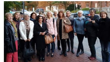
Foto: Frauen beim Landtag in Kiel 2017

Tel. 122-1615, www.frauenbuero.luebeck.de