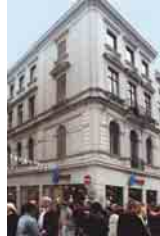
Ecke Breite Str. (rechts)