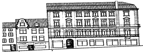
Fleischhauerstr. 2 (rechts) bis 14. Stadtbildaufnahme 1990: Büning