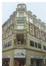
Ecke Breite Str. 73. wohl 2004-2005