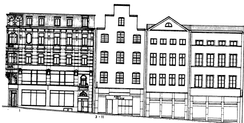
Fleischhauerstr. 1-7. Stadtbildaufnahme 1990: Büning