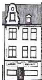
Fleischhauerstr. 4. Stadtbildaufnahme 1990: Büning