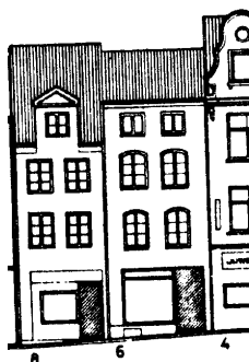
Fleischhauerstr. 6: Stadtbildaufnahme 1990; Büning 100

- Taxationen 1798: 4.100 ml; 1931: 10.800 RM