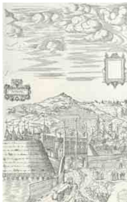
Diebel, Holzschnitt 1552