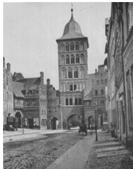
1921. Heise 2.41

Andresen 1.59 Lü Stadtbild Nr. 52,52 Lü Stadtansicht Nr. 99,99 Lindtke, Stadt 80 Milde 2.16,17; Milde 3.15 Bf Wagen 1965.76 Lü zur Zeit 9 BKDHL 1.1:148 Bürger Nachr. 2005/94.1 Holm 21 Finke 3.200 Bremse 81 Heise 2.41 Finke 3.203 Bf Federau 36 Bf Milde 2.16,17