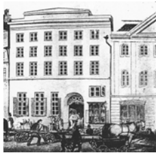
1850er Jahre.