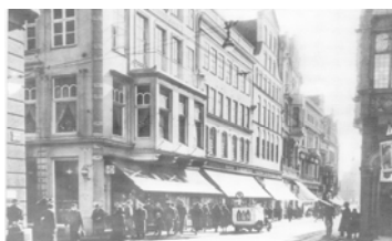
1920er Jahre.