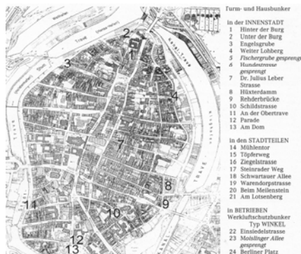
Tag d. offenen Denkmals 2005

Nationalsozialismus in Lübeck 1933-1945.76