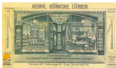
Breite Str. 38 (wohl 1909)