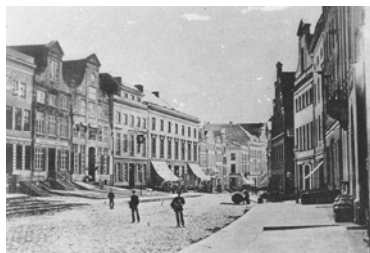
vor 1866.