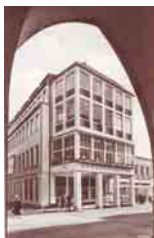
Breite Str. 89.