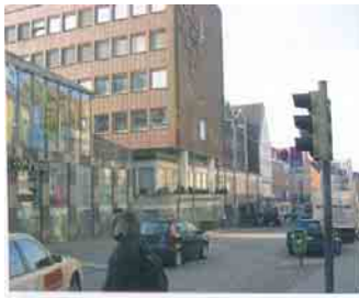
Landesbankgebäude Ecke Beckergrube/ Breitestraße vor dem Abriss 2008