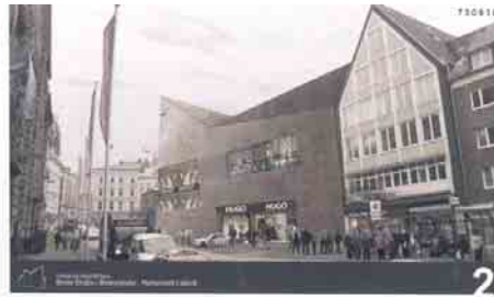
Simulation eines Kaufhausneubaus Ecke Becker- grube/Breite Straße, Stand 2007

aus: Antonius Jeiler, Wagen 88/2008.18 (und – rechtes Bild) – Bürgernachrichten 104