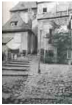
Albrecht 3.49. aus der Bildlegende: „...hier ist der Blumenhof zu sehen“